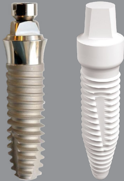
© Titanimplantat: sisma - AdobeStock.com © Keramik-Implantat: Swiss Dental Solutions